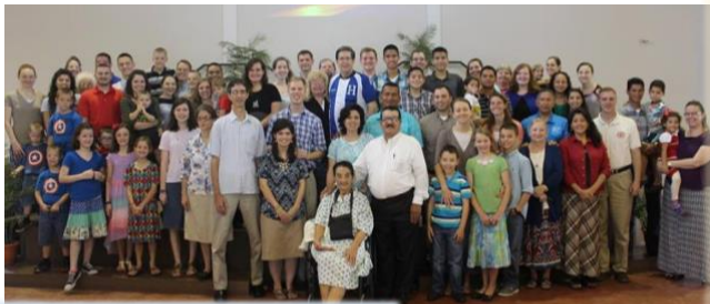
Misioneros norteamericanos de Honduras y El Salvador reúnen en la conferencia.

Mi iglesia organizó su sexta conferencia anual para misioneros este Febrero. Ésto es una oportunidad para misioneros que hablan inglés a disfrutar compañerismo y estar edificado de la Biblia en su lengua materna. Fue una bendición ser parte del evento por mi segunda vez, y sentirme animada por otro año del ministerio.