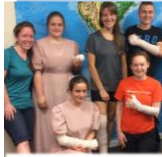
Aprendimos como hacer tablillas en MMI.

(Éste es el símbolo de interpretación de señas en EEUU)